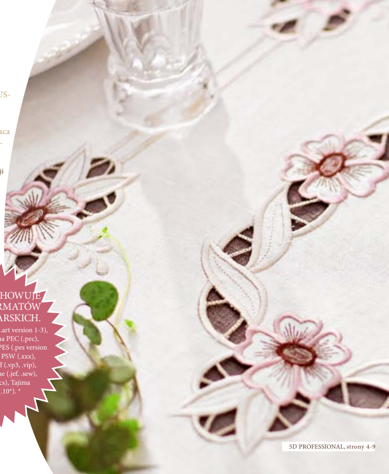
5D PROFESSIONAL, strony 4-9