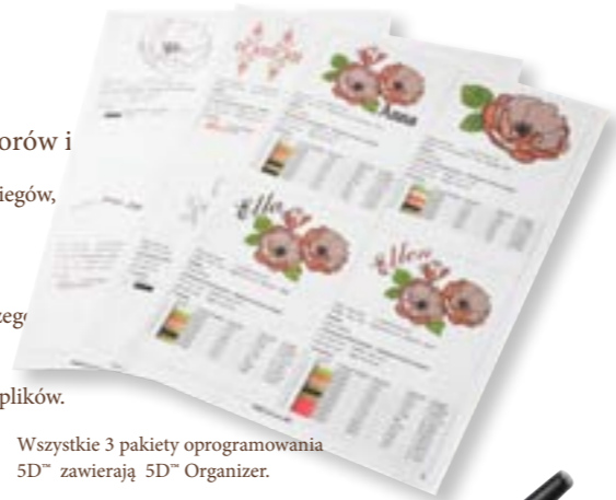
Wszystkie 3 pakiety oprogramowania 5D™ zawierają 5D™ Organizer.