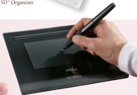
Zestaw do rysowania Inspira 4D™ Drawing Kit. Zawiera tablet i pióro, bardzo ułatwia tworzenie wzorów, obrys wybranych elementów wzoru, itp. Dodatkowo zawiera 5000 zdjęć.